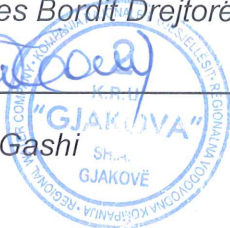
Z. Urim Gashi